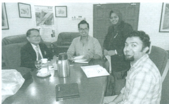
เราจากแนวทางการส่งนักศึกษาและบุคลากรเข้าร่วมโครงการแลกเปลี่ยนกับทีมงานด้านต่างประเทศและดูงานห้องเรียนหลักสูตรระยะสั้น