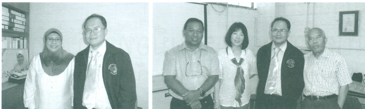
การพบปะพูดคุยแลกเปลี่ยนความคิดเห็นคณาจารย์ในวิทยาลัยวิทยาศาสตร์ชีวภาพ (School of Biological Sciences) เพื่อหาแนวทางแลกเปลี่ยนนักศึกษาและคณาจารย์ด้านการเรียนการสอน งานวิจัยและศิลปวัฒนธรรม

นักศึกษาไทยนิยมมาเรียนหลักสูตรภาษาอังกฤษกันมาก ไม่ว่าจะเป็นการเรียนเพื่อเตรียมความพร้อมเพื่อเข้าศึกษาต่อในระดับมหาวิทยาลัย หรือมาพัฒนาความสามารถทางภาษาอังกฤษสำหรับอาจารย์ที่อยู่ในเขตพื้นที่ภาคใต้ หากติดต่อให้มหาวิทยาลัยจัดหลักสูตรให้โดยตรง จะได้ระยะเวลาตามที่คุณเรียนต้องการได้ ทาง USM ได้เสนอที่จะมาทำกิจกรรมเข้าค่ายภาษาอังกฤษ (English Camp) นอกสถานที่ หากนักศึกษาไทยไม่พร้อมที่จะเดินทางไปมาเลเซียหรืออาจจะมีงบประมาณจำกัด