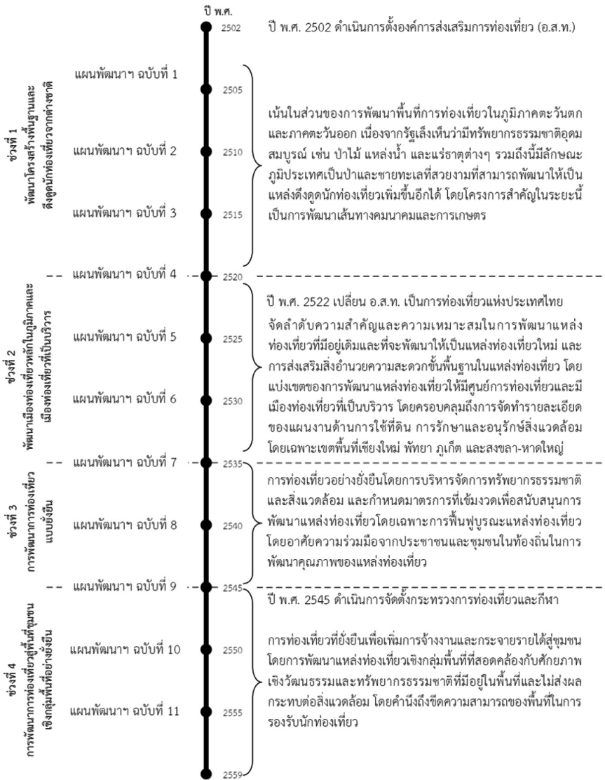
รูปที่ 1 พัฒนาการเชิงนโยบายด้านการท่องเที่ยวของประเทศไทย