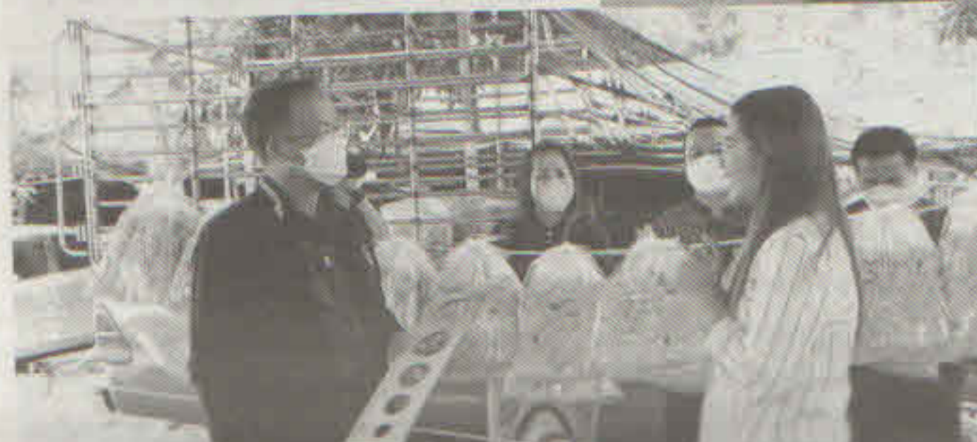
โครงการนำลูกหลานเกษตรกรกลับบ้าน สานต่ออาชีพการเกษตร สมัครเข้าร่วมโครงการทันที “กลับมาอยู่บ้านมี 2559 ตอนลาออกจาก ประกันได้เงินเดือน 30,000 บาท 86คน ได้ 3,000 บาท และก็มีได้ทุกวัน ก็เลยมีความ