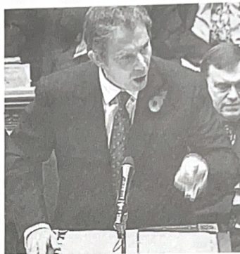
● นายกรัฐมนตรีอังกฤษ โธนี่แบลร์ ประณามมิโลเชวิชว่าเป็นตัวการก่อการนองเลือดในบอสซา