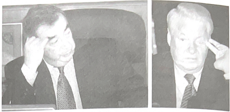
● นายกรัฐมนตรีปริมาคอฟและประธานาธิบดีเบลคซัน ประณามนาโตและคลืนต้นว่ารุกรานยูโกสลาเวีย ทำให้วิกฤตการณ์เลวร้ายลง รัสเซียประกาศยืนอยู่ข้างยูโกสลาเวียแต่ก็ไม่กล้าส่งกองทัพมาสู้กับนาโต