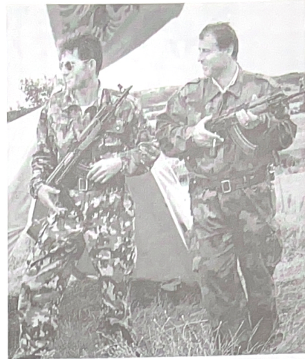
● คนส่วนหนึ่งเข้าร่วม "กองทัพปลดแอกโคโซโว" เพื่อจับอาวุธลุกขึ้นสู้ต่อต้าน เซอร์เบีย