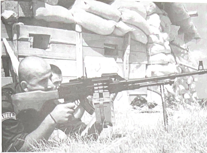
● หน่วยล่าสังหารของมิโลเชวิช กำลังปฏิบัติการกวาดล้างหมู่บ้านของชาวพื้นเมืองอัลบาเนีย-กลใกล้สำคัญในการฆ่าล้างเผ่าพันธุ์