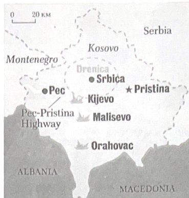
● แผนที่โคโซโวแคว้นหนึ่งในอาณาจักรของยูโกสลาเวีย อยู่ใกล้อัลบาเนีย และมาเซโดเนีย

ประธานาธิบดีโลโบคาน มิโลเชวิช ผู้สั่งการให้มีการฆ่าล้างเผ่าพันธุ์ที่ยูโกสลาเวียบอสเนียและโคโซโว