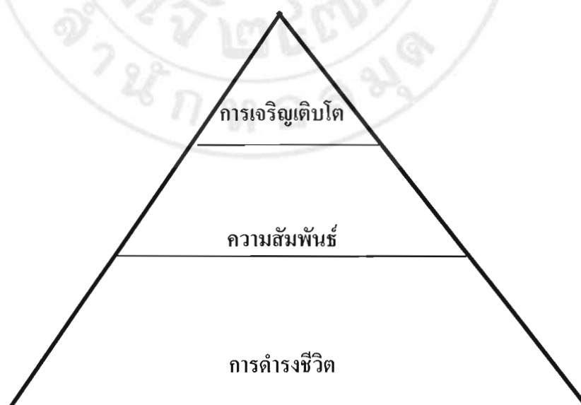
ภาพ 2 แสดงลำดับความต้องการของแอลเดอร์เฟอร์

2.3 ความต้องการเจริญเติบโต (growth needs) คือ ความต้องการภายในเพื่อการพัฒนาส่วนบุคคล ความต้องการของบุคคลที่จะเจริญเติบโตพัฒนาและใช้ความสามารถของพวกเขาอย่างเต็มที่ ด้วยการแสวงหาโอกาสและการเอาชนะด้วยความท้าทายใหม่ ๆ ความต้องการเหล่านี้จะถูกตอบสนองด้วยการมีส่วนร่วมของบุคคลภายในสภาพแวดล้อมของงาน ความต้องการเจริญเติบโตจะตรงกับความต้องการเกียรติยศชื่อเสียงและความต้องการความสมหวังของชีวิตของมาสโลว์